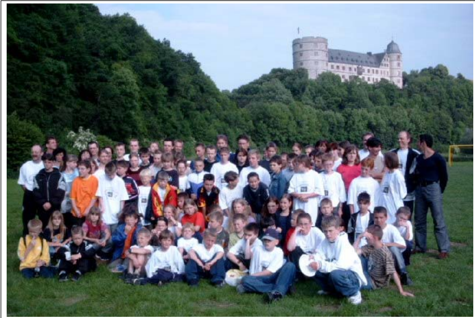
2. Jugend-Trainingscamp auf der Wewelsburg in Büren bei Paderborn